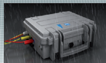
PQA820 im robusten Koffer (IP65)