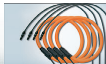
4 flexible Stromwandler 1000 A AC