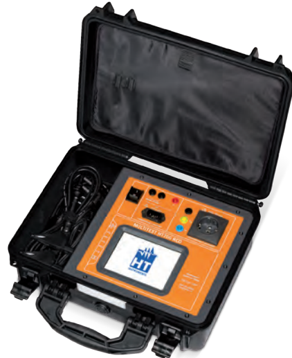
MULTITEST HT700 RCD Art.-Nr.: 2009800