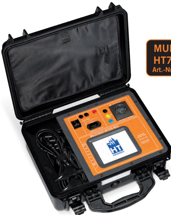
MULTITEST HT700 ARC Art.-Nr.: 2009780