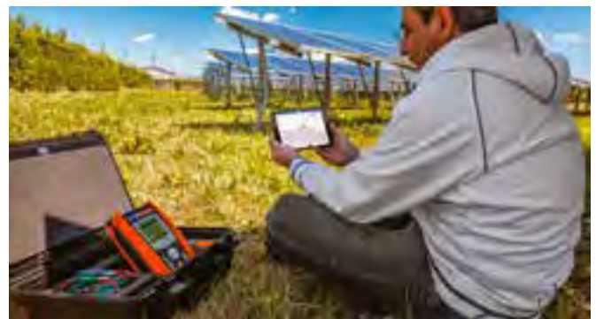
Auswertung und Protokollerstellung der U-I Kennlinie mit Ihrem Smartphone oder Tablet und der App HTANALYSIS™