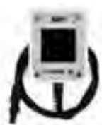
HT304K Duo Referenzzelle