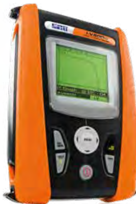
I-V500w Art.-Nr.: 1008665