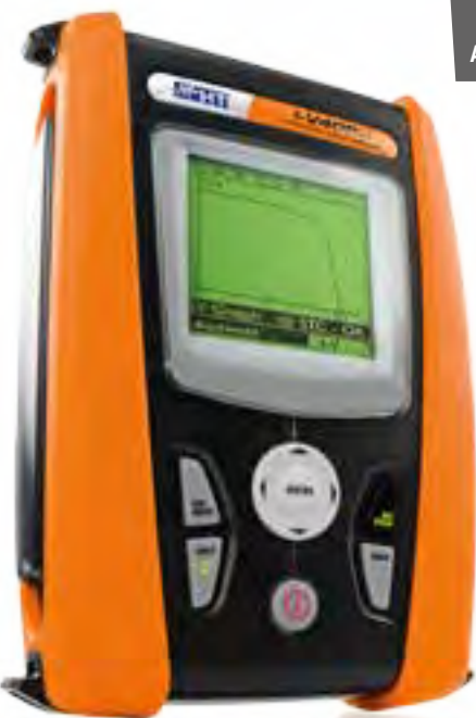
I-V400w Art.-Nr.: 1008661