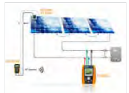
Anschluss I-V400w an HT304K über externen Datenlogger SOLAR-02