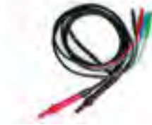
KIT KELVIN Messleitungsset (optional) In Funktion "AutoSequenz Messung" automatisch starten und speichern.