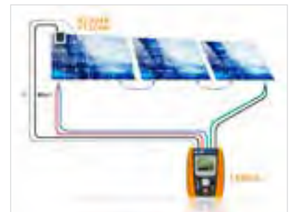
Anschluss I-V400w direkt an HT304K