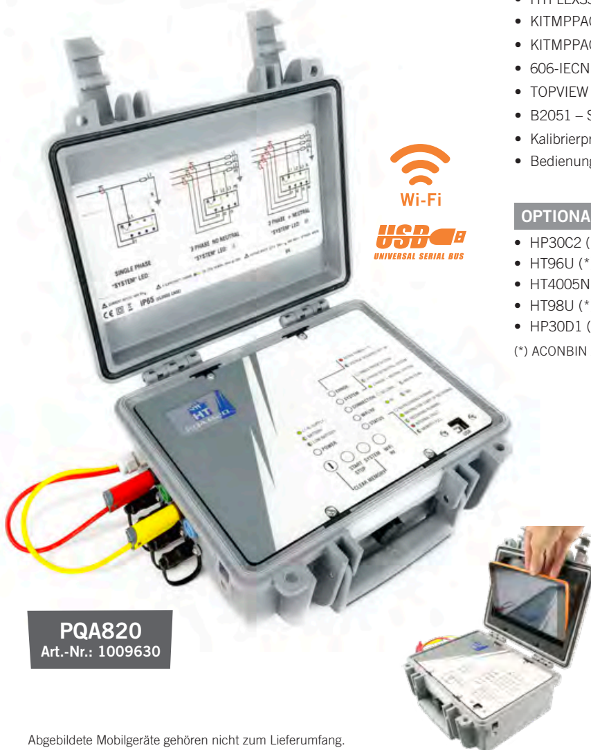
PQA820 Art.-Nr.: 1009630

(*) ACONBIN Adapter für Verbindung zu PQA820 erforderlich (siehe Seite 137)